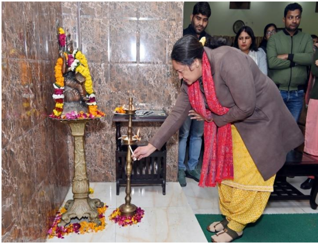
LAMP LIGHTENING CEREMONY