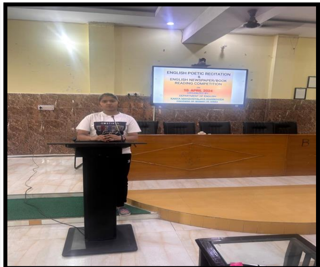
GLIMPSES OF THE EVENT